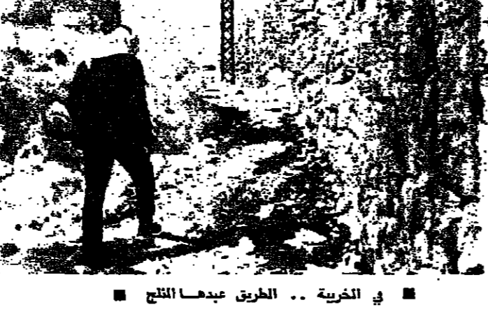
زلجة - من مراسل (الانوار):

اذا كان التزوح وجها من وجوه التزلج في المناطق، وفي الوقت نفسه سببا من اسبابه، فالمسألة الحقيقية أصليا هي في عدم القدرة .. حتى على التزوح - وكثيره هي القرى البعيدة المخرومة، لكن قرية «الخوية» في قضاء بعلبك، تعتبر نموذجيا «مثاليا» حزينا للمظلم الاجتماعي في لبنان.